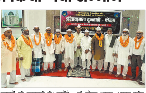
हज पर जाने वाले हज यात्रियों से देश में अमन चैन और तरक्की की दुआ मांगने की अपील की गई।

बाता दें कि प्रतिवर्ष बड़ी संख्या में मुस्लिम समाज के लोग पवित्र धर्म स्थल मक्का मदीना शरीफ में हज पर जाने वाले हज यात्रियों हेतु सम्मान समारोह आयोजित किया गया। नाजमिया मस्जिद रसूलपुर में आयोजित कार्यक्रम के दौरान हज यात्रियों का फूल माला से स्वागत किया गया और मिलाद शरीफ के बाद दुआ मांगी गई। इसके साथ ही हज पर जाने वाले हज यात्रियों से देश में अमन चैन और तरक्की की दुआ मांगने की अपील की गई।