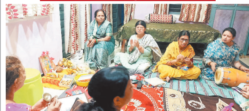
बैकुंठपुर। गहोई समाज के महिला मंडल द्वारा बाजारपारा में विधि-विधान से सुंदरकाण्ड कार्यक्रम का आयोजन किया गया। पूजा-अर्चना के पश्चात श्रद्धालुओं को प्रसाद वितरण भी किया गया।