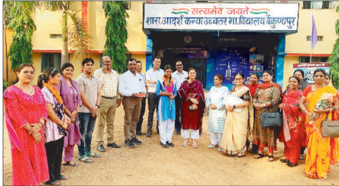
बधाई देने स्कूल पहुंची कलेक्टर समेत अन्य लोग।

ने अपनी सफलता का श्रेय नियमित अध्ययन, समय प्रबंधन, शिक्षकों के मार्गदर्शन और माता-पिता के सहयोग को दिया। उन्होंने भविष्य में जेईई की तैयारी कर भारतीय प्रशासनिक सेवा में जाकर देश सेवा